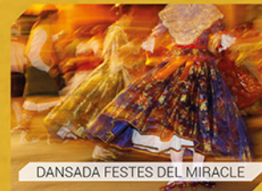
DANSADA FESTES DEL MIRACLE