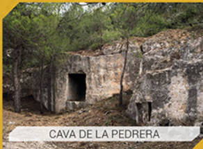
CAVA DE LA PEDRERA