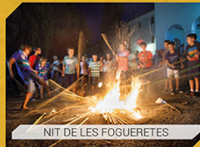
NIT DE LES FOGUERETES