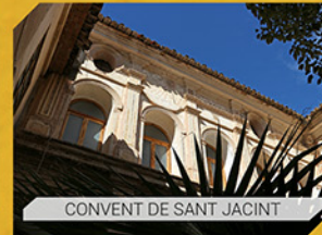
CONVENT DE SANT JACINT