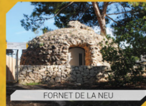
FORNET DE LA NEU