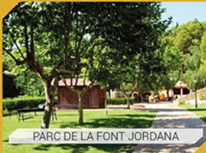
PARC DE LA FONT JORDANA