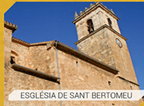
ESGLÉSIA DE SANT BERTOMEU