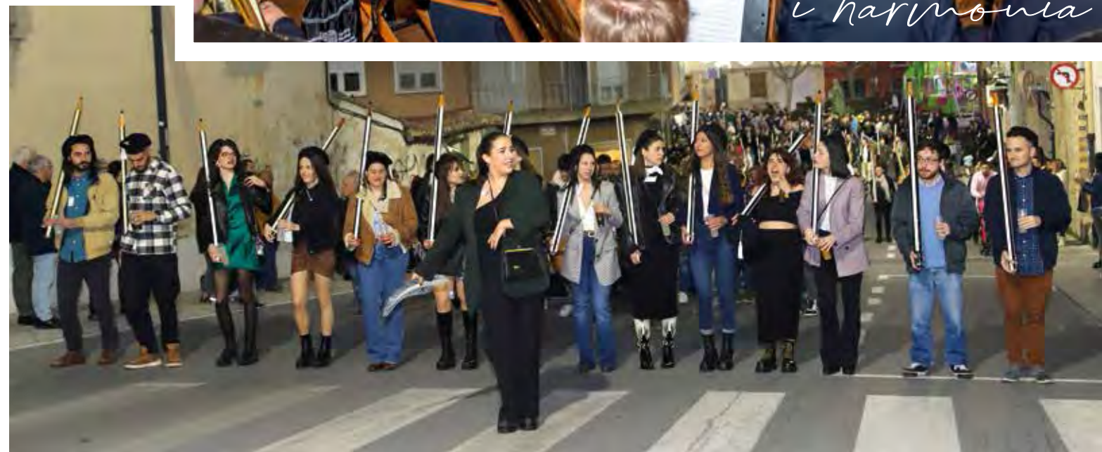
Entraeta Filà dels Estudiants. 11 de març de 2023.