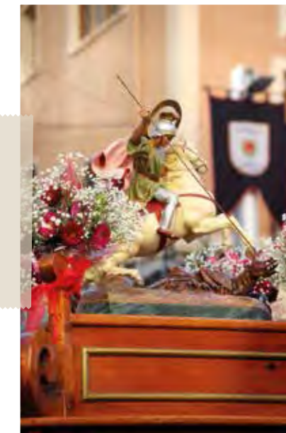
Capitans de la Filà Contrabandistes al Trasllat del Sant Jordi. 25 d'abril de 2023.