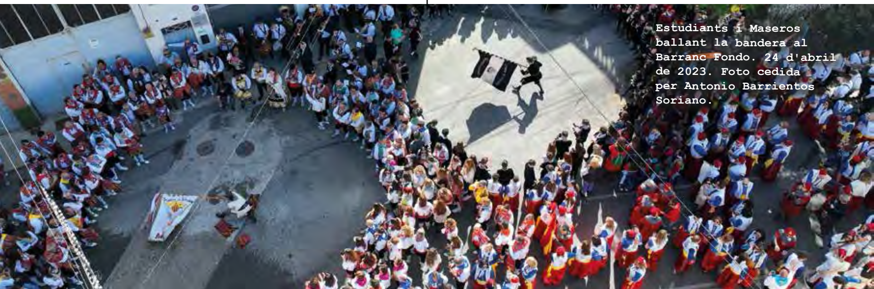
Estudiants i Maseros ballant la bandera al Barranc Fondo. 24 d'abril de 2023.

A las 23:30 h , Disco-móvil en el Parque Municipal de Villa Rosario y a las 23:55 h , Cordà en la plaza Major.