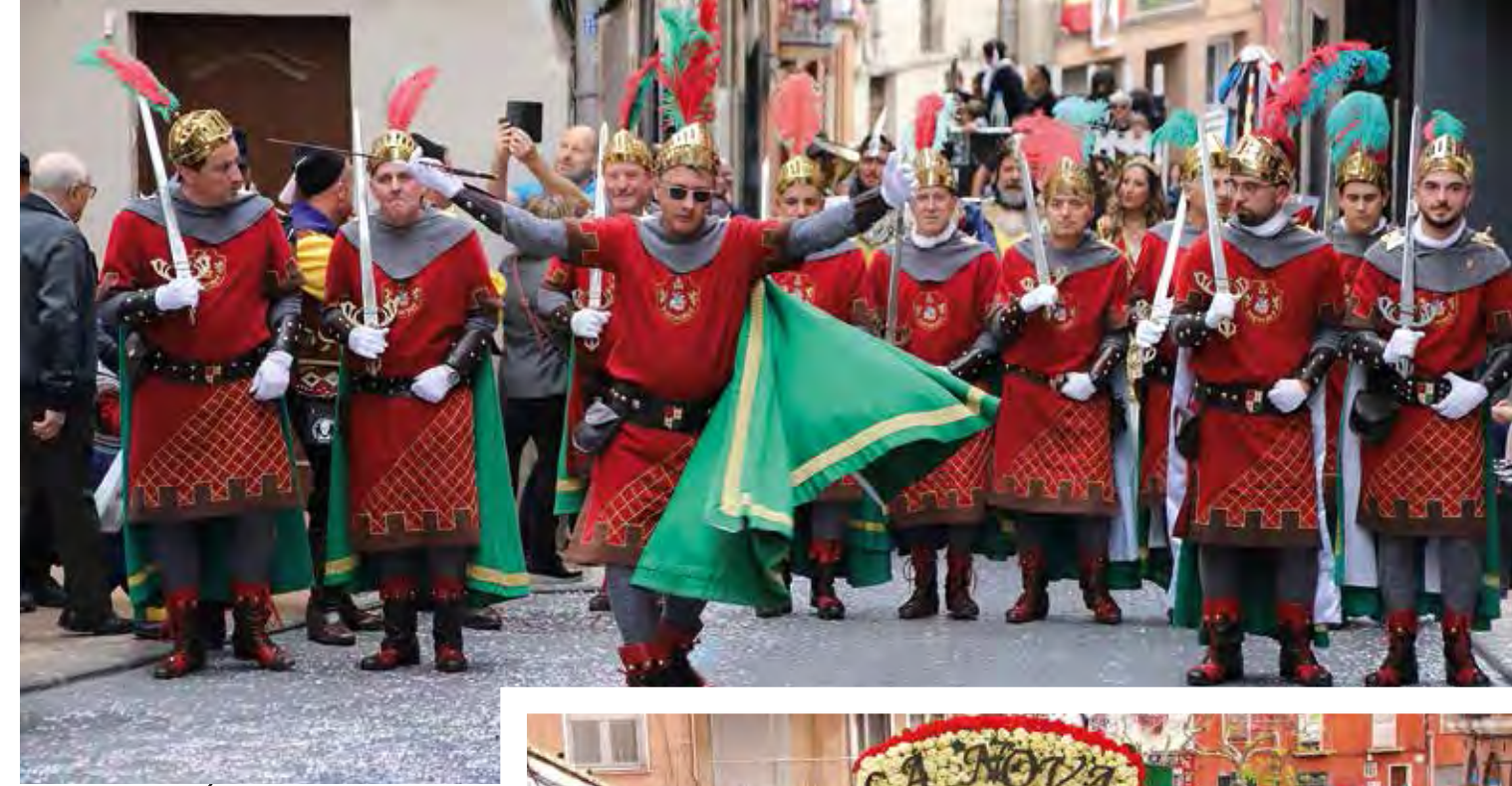
Esquadra de la Filà Cristians desfilant a l'Entrada. 22 d'abril de 2023.

A continuación del Pasacalle, Disco-móvil en el Parque Municipal de Villa Rosario.