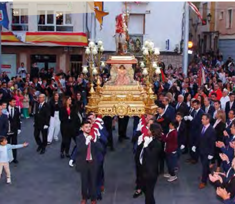
Trasllat del Patró Sant Jordi. 21 d'abril de 2023.

A les 00:30 h, Revetlla , al Parc Municipal de Vil·la Rosario.