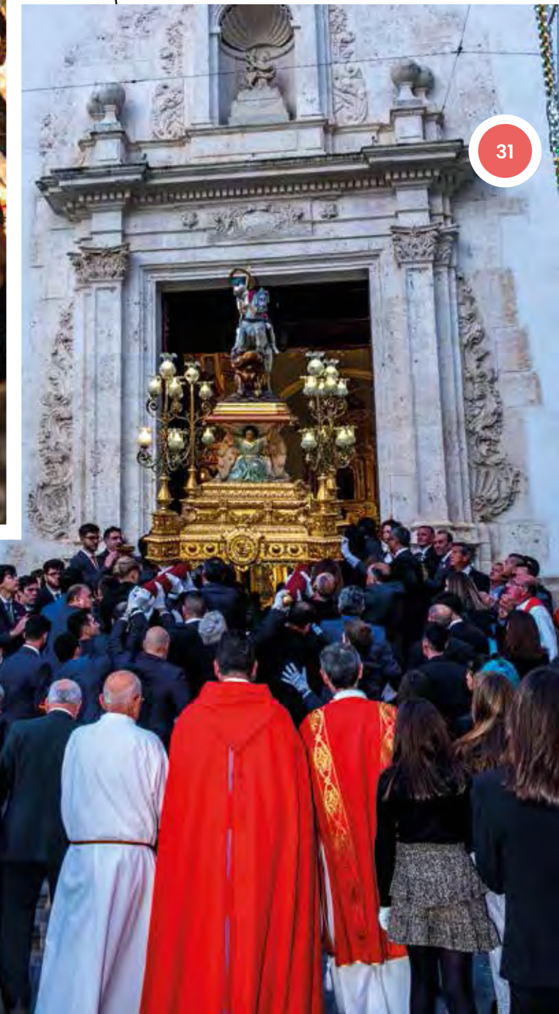
Trasllat del Patró Sant Jordi. 21 d'abril de 2023.