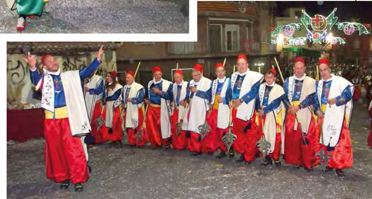
Esquadra de la Filà Moros Nous desfilant a l'Entrada. 22 d'abril de 2023.