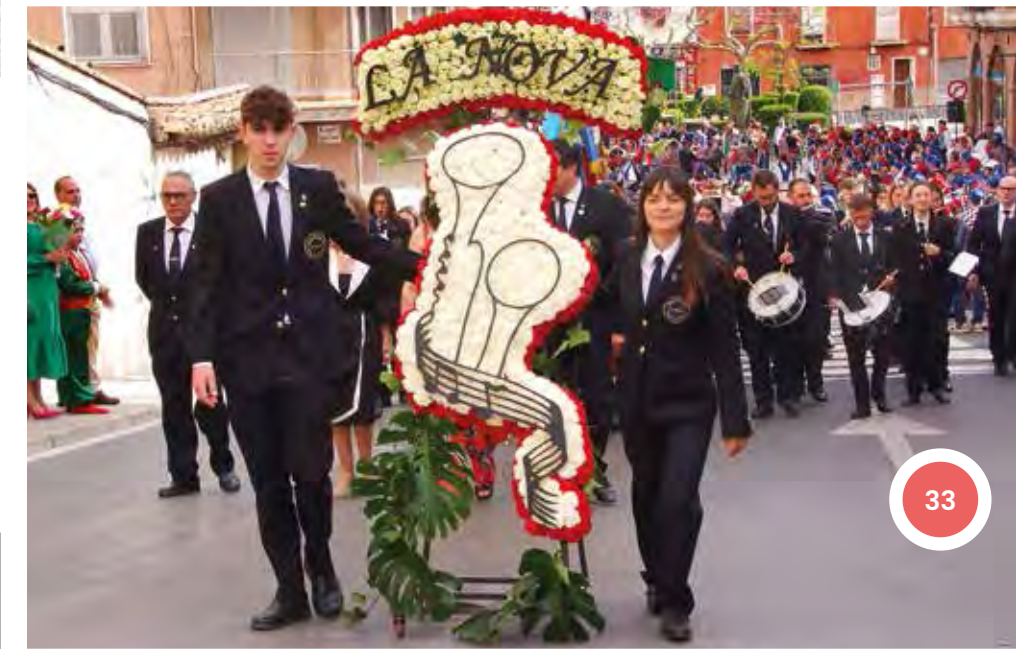
Agrupació Musical "La Nova" a l'Ofrena de flors. 22 d'abril de 2023.