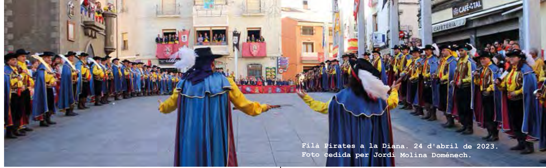
Filà Pirates a la Diana. 24 d'abril de 2023.

A les 23:00 h , Disc-mòbil al Parc Municipal de Vil·la Rosario i a les 23:55 h , Cordà a la plaça Major.