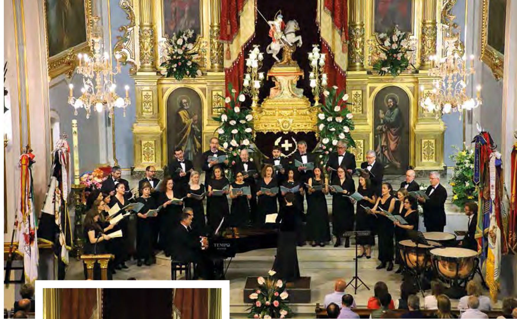
Concert del Cor de Cambra Amalthea. XLII edició de les Jornades Musicals de l'Octavari de Sant Jordi. 30 d'abril de 2023.

Misa y traslado en procesión de la imagen de San Jorge a su ermita. Saldrá del Templo Parroquial de la Nuestra Señora de la Misericordia y recorrerá la plaza Major y las calles Àngel Torró, Sant Jaume, Felip IV y Major. Pasará nuevamente por la plaza Major y la carrer Sant Jordi. A la llegada del Santo a su ermita, se disparará un castillo de fuegos artificiales.