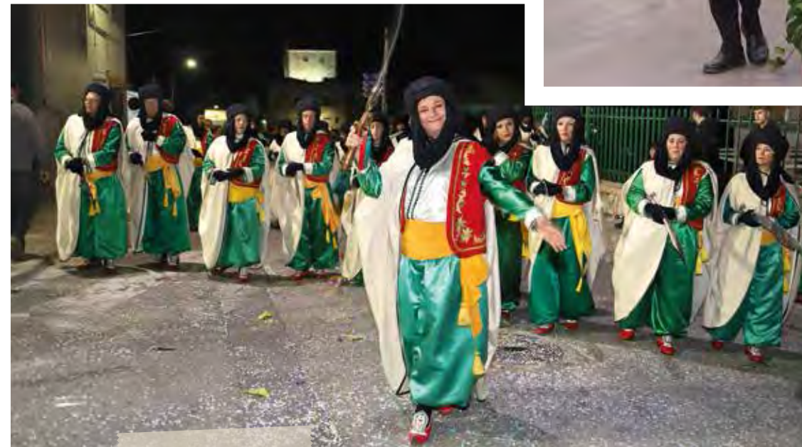
Esquadra de la Filà dels Califes desfilant a l'Entrada. 22 d'abril de 2023.