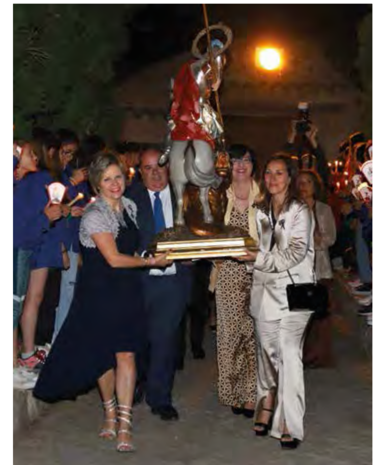
Entrada de la imatge de Sant Jordi a la seua ermita. 6 de maig de 2023