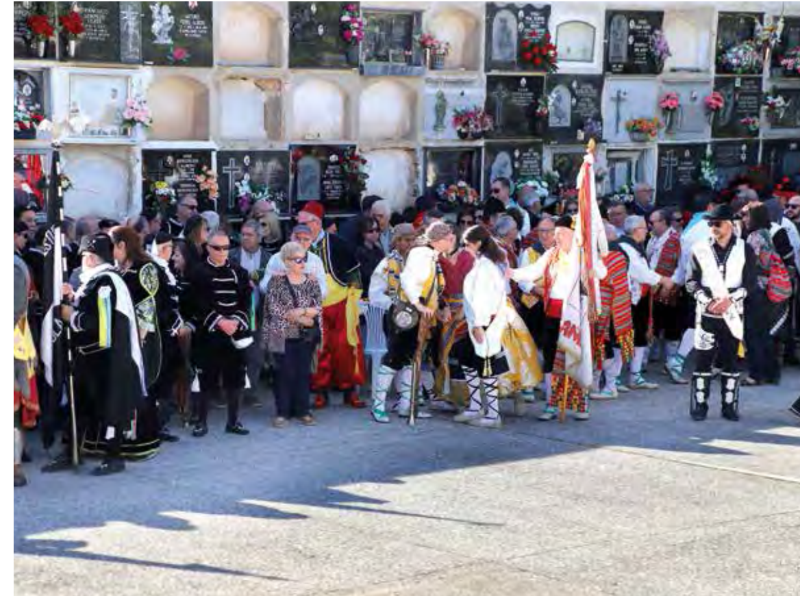
Festers a la Missa del cementeri. 25 d'abril de 2023.