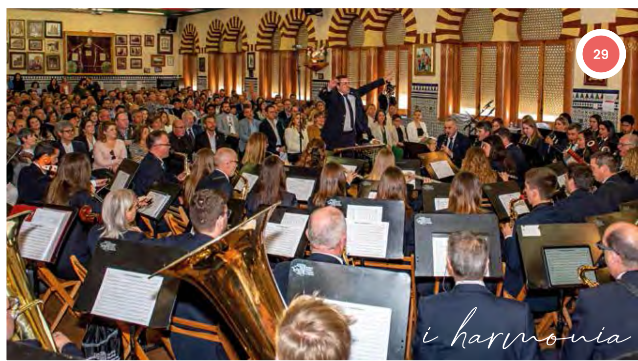
XXVIII edició del Concert de música festera Filà de Moros Vells. 2 d'abril de 2023.