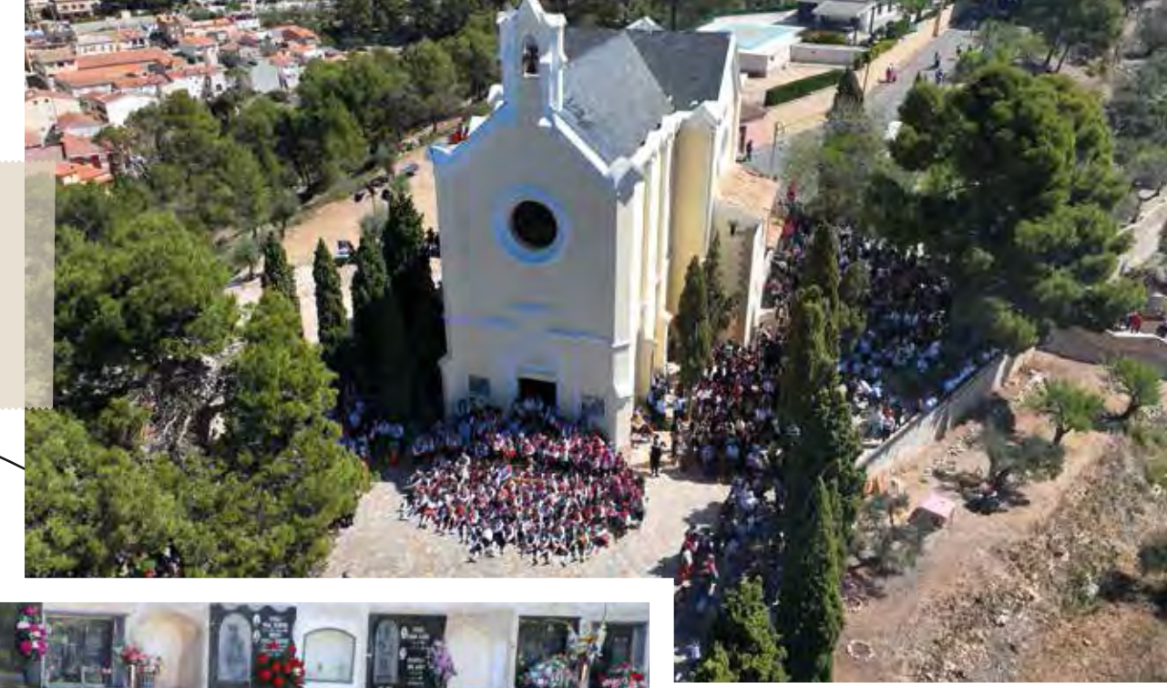
Maseros al Sant Crist. 25 d'abril de 2023.

A las 23:55 h , Cordà en la plaza Mayor.