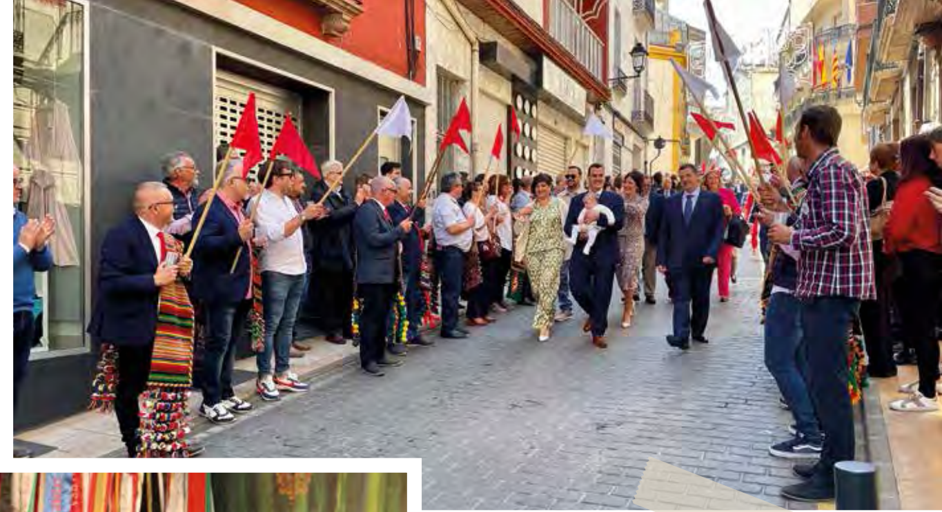
Filà Contrabandistes obrint filees als batejos del Dia de Glòria. 9 d'abril de 2023.

A las 00:30 h, Verbena , en el Parque Municipal de Villa Rosario.