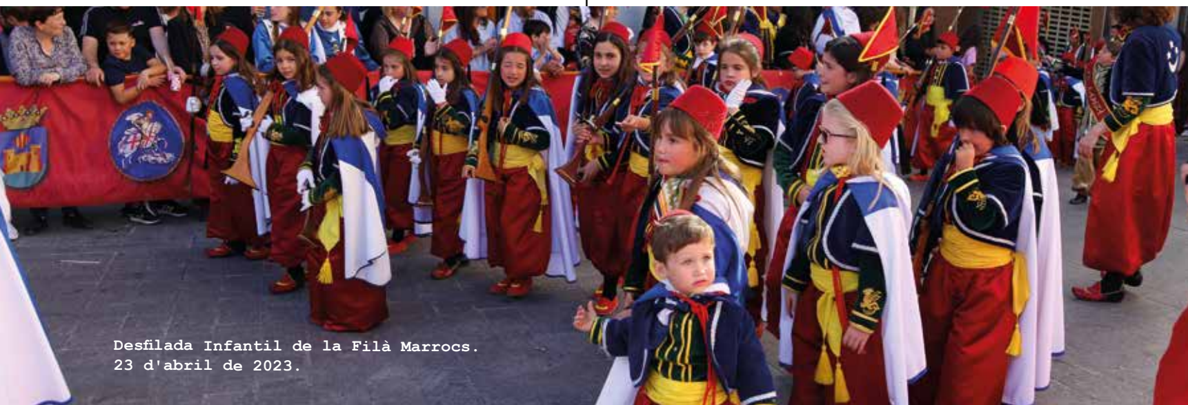
Desfilada Infantil de la Filà Marrocs. 23 d'abril de 2023.

A las 00:30 h , Disco-móvil , en el Parque Municipal de Villa Rosario.