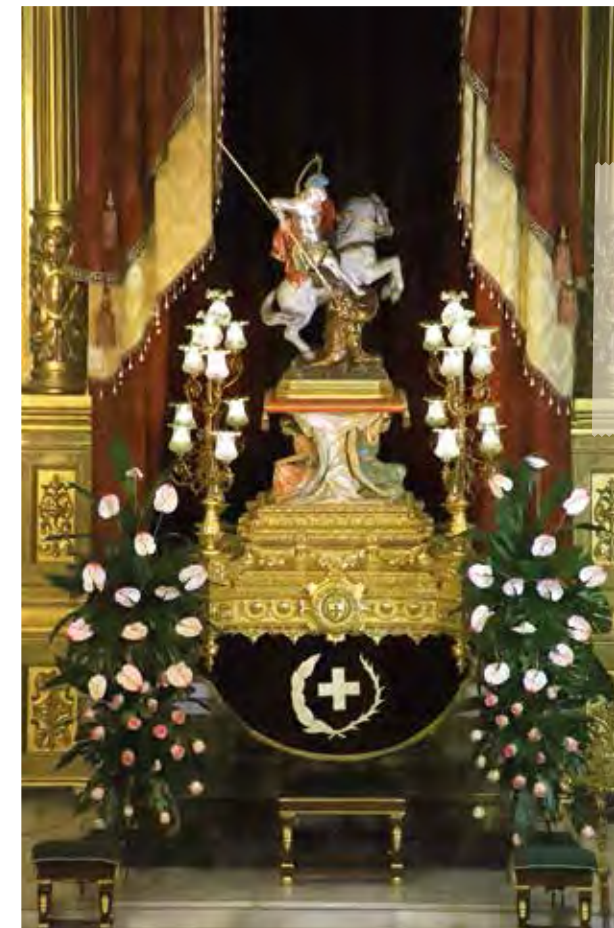
Imatge de Sant Jordi a l'Altar Major. 30 d'abril de 2023.