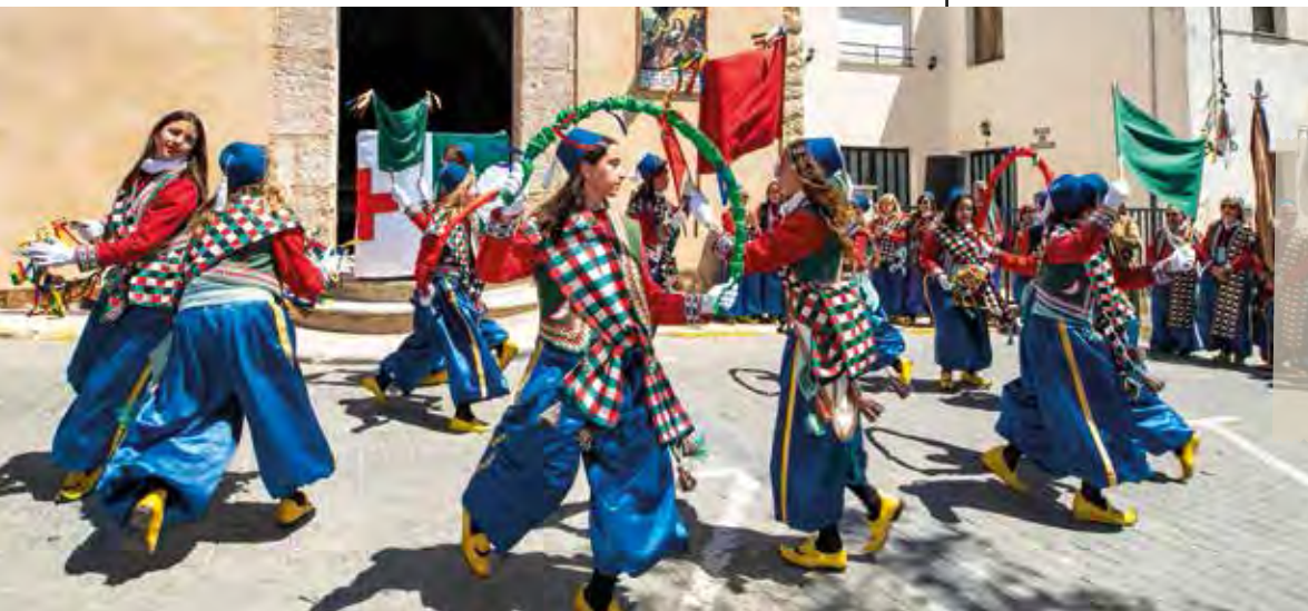
Ball Moro. 25 d'abril de 2023.