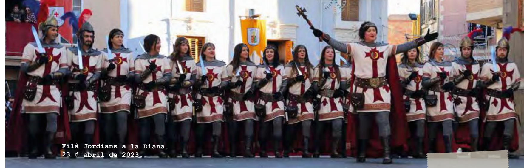
Filà Jordians a la Diana. 23 d'abril de 2023.

A les 00:30 h , Disc-mòbil , al Parc Municipal de Vil·la Rosario.